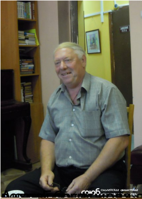
Образ баяры вож отвой выбор А.Г.М.учити де сь дивка во ех рожит едревинки