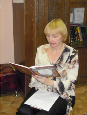
Мэчэны сь сь мива тмэлитовжыт сь тми Об сь нирачи тэн Вадкова. выразительно.