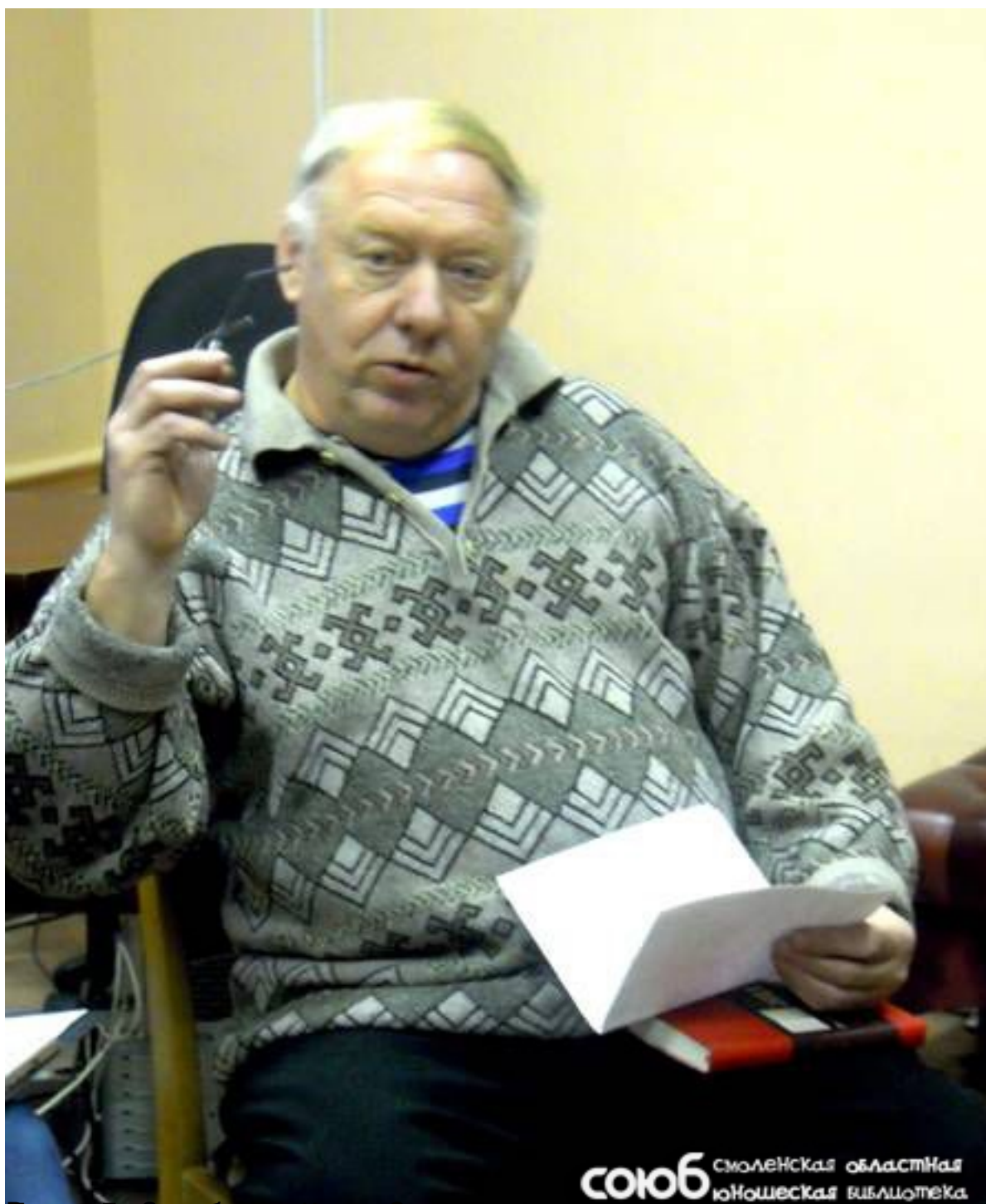
Вопросы. Сообщением о Константине Случевском.