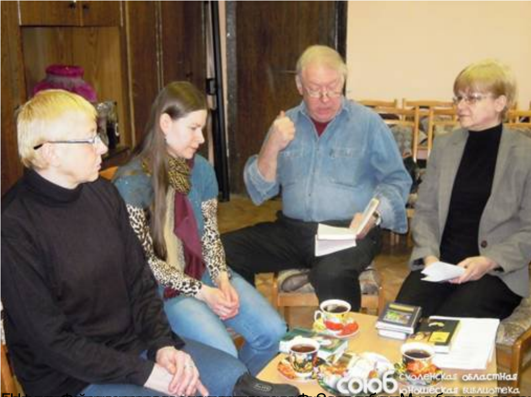
Библиотекарь читает книгу в библиотеке. Смоленская областная юношеская библиотека