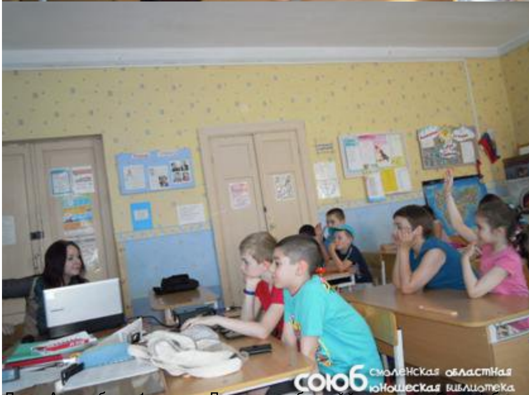
Директор библиотеки вводит в действие новую систему, которая обеспечивает каждому ребенку доступ к информации в интернете