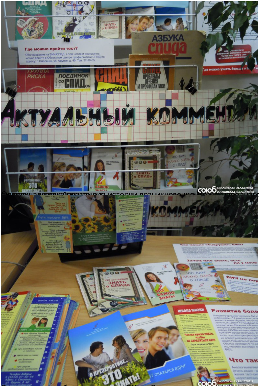
В центре внимания - актуальная информация об истории возникновения ВИЧ-инфекции, ее путях передачи, профилактике и лечении. В центре внимания - актуальная информация об истории возникновения ВИЧ-инфекции, ее путях передачи, профилактике и лечении.