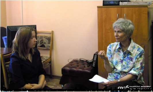
Участники мероприятия в библиотеке