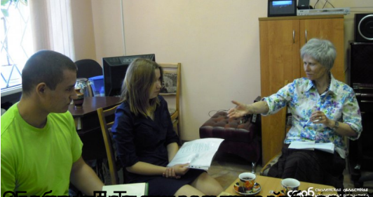
Участники мероприятия в библиотеке