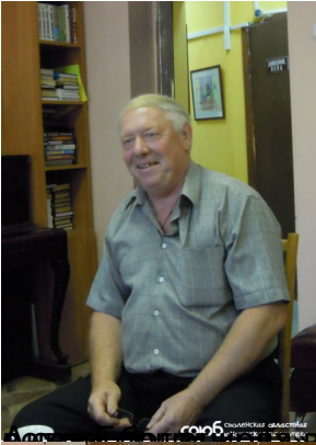
Образ героя в стихе о своем выборе А.С. Пушкина «Бродяга воех архаич в деревню»