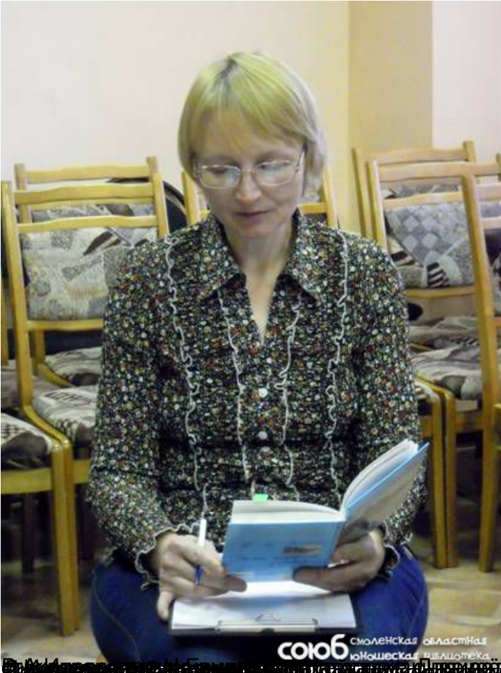
Видеосъемка работы волонтера в библиотеке