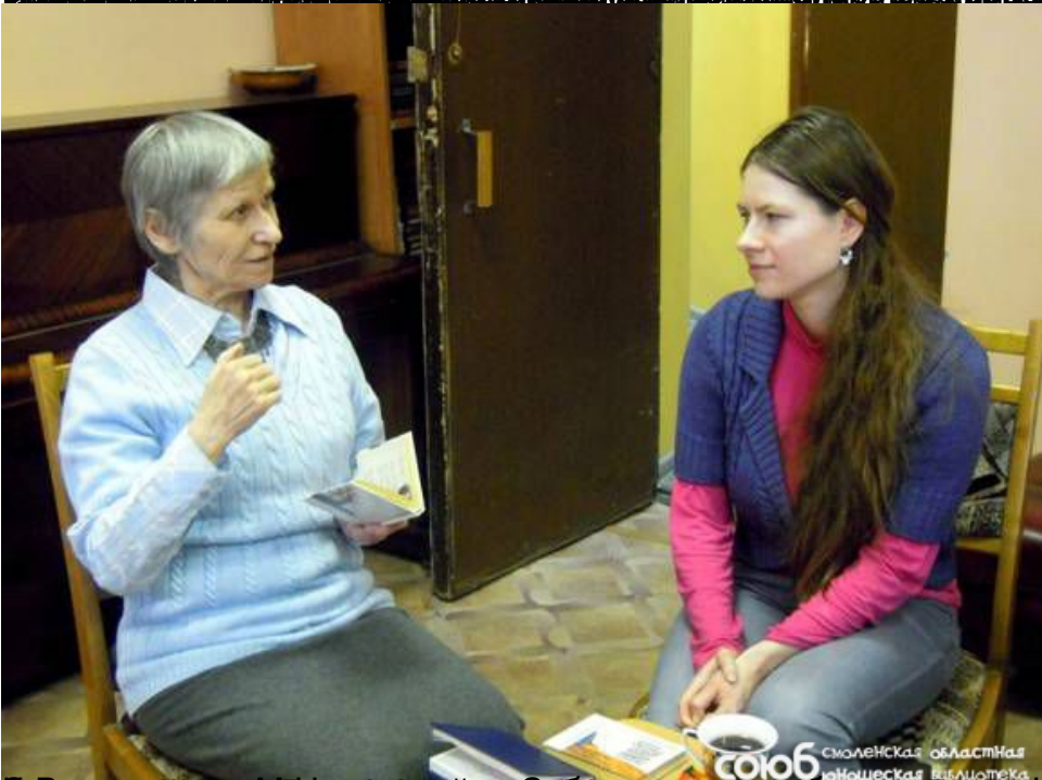
Видеосъемка работы волонтера в библиотеке