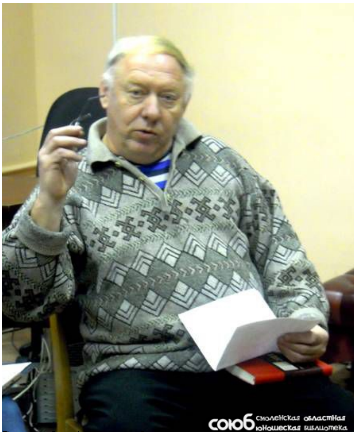
Встреча с Союзом библиотечных работников. Сообщение о Константине Случевском.