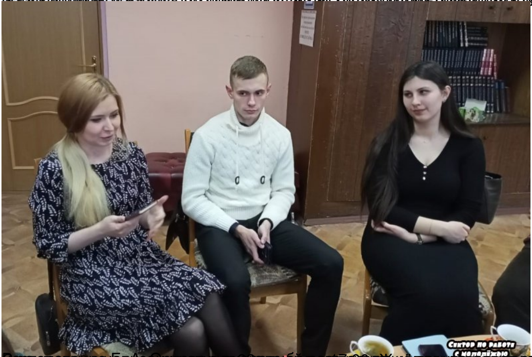
Благодарю за участь у конкурсі та за надання інформації про конкурсні умови. Окремі запитання можна задавати за адресою: info@smolensk.com