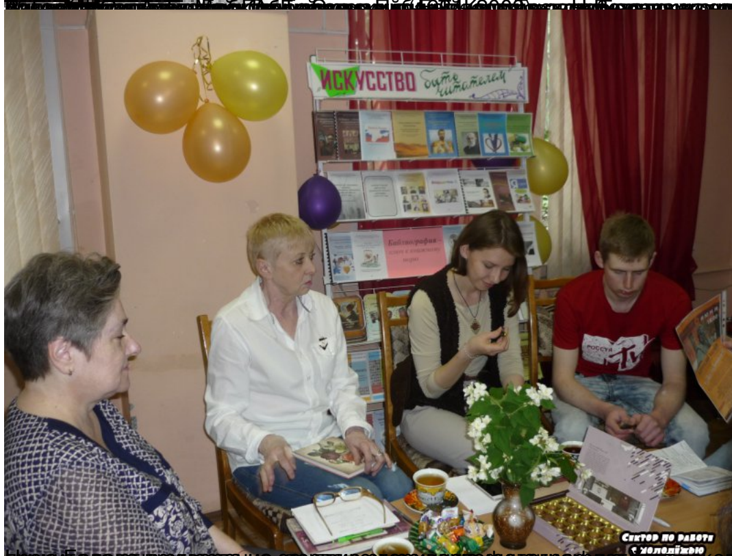
Проявлява и проинвирани, за свята еснаде в еурофонан градот еванского собора и