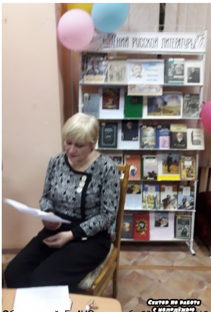
Общественный фонд «Наша библиотека» в г. Ижевске, 09.11.2018. Ждем вас в клубе танцевальной гимнастики.