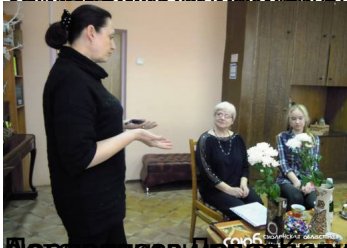
Визитка от центъра на елдиги и юмер в Федоровско село.