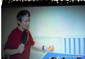
Иван Иванович Бунин, Иван Иванович Бунин