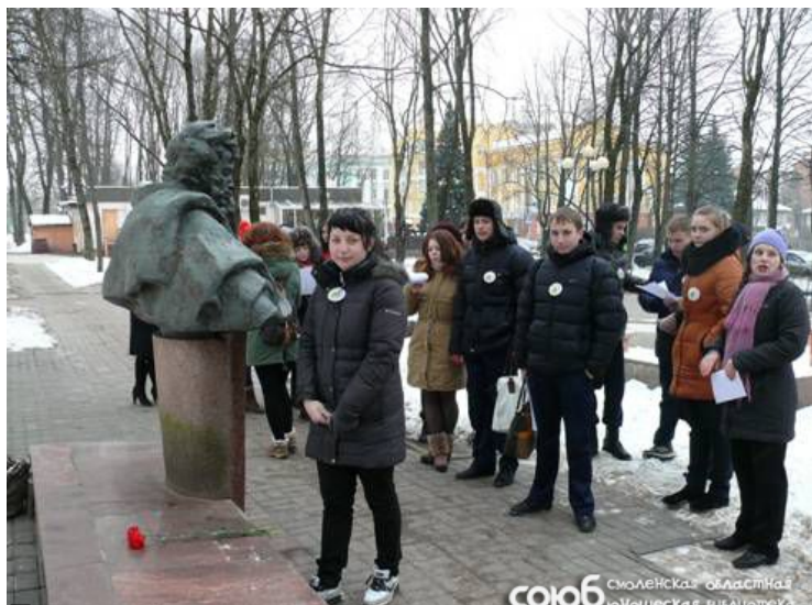
Еще воспитанники библиотеки – студенты училища – вернулись в стены библиотеки,