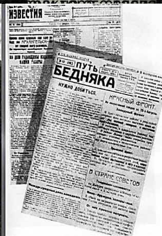
Ельнинская уездная газета.