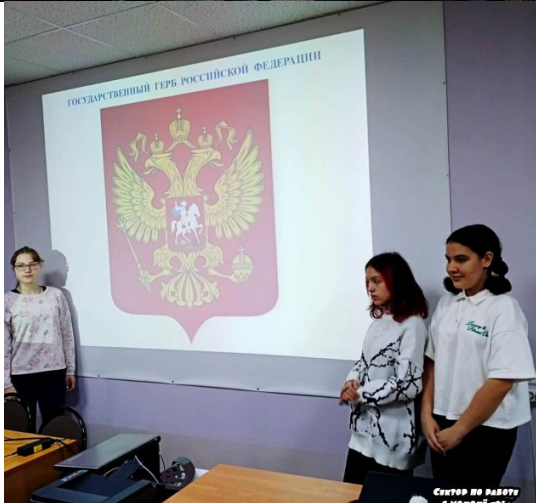
Система работы с молодежью