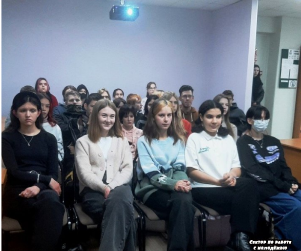
Система работы с молодежью