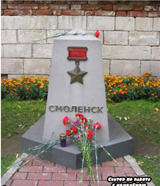
Сектор по работе с молодежью

Возвращаясь к теме, мы вспоминаем тех, кто не вернулся с войны, и народ, устоявший в тяжелые годы