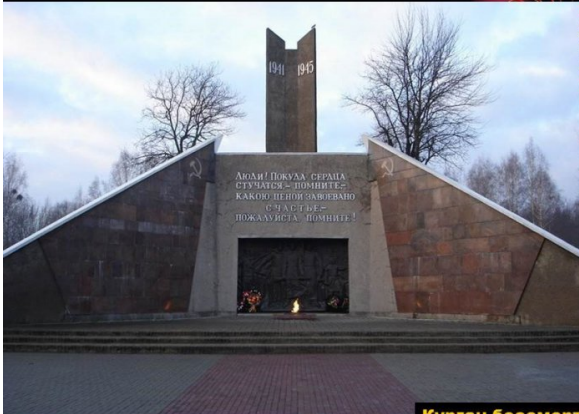
Курган бессмертия в память погибших в борьбе с фашистами Сектор по работе с молодежью

Возвращаясь к теме, мы вспоминаем тех, кто не вернулся с войны, и народ, устоявший в тяжелые годы