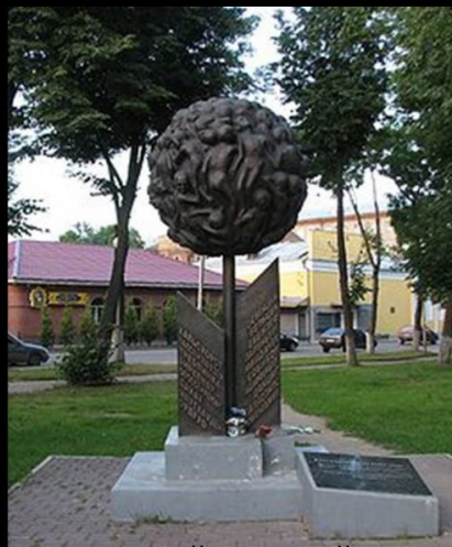
Памятник малолетним узникам фашизма «Опаленный цветок» Сектор по работе с молодежью

Всегда в нашей памяти остаются участники, которые погибли на войне и всех ушедших