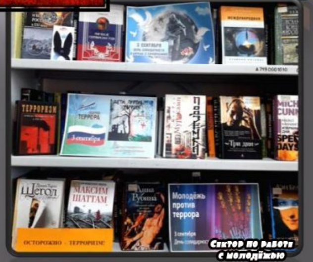
Сектор по работе с молодежью