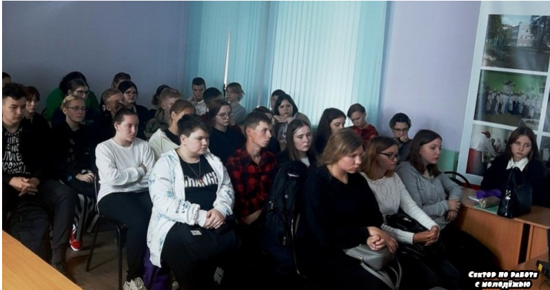
Сектор по работе с молодежью