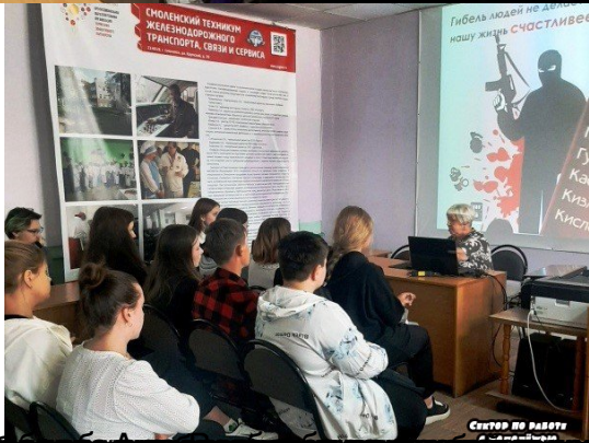
Сектор по работе с молодежью