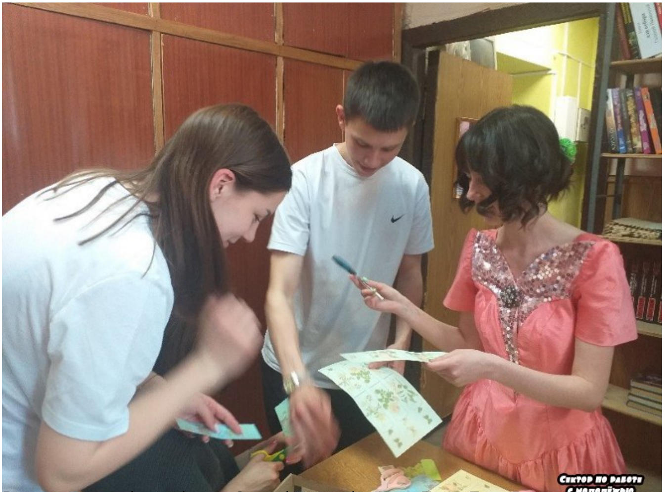
Відвідувачі бібліотеки беруть участь у конкурсі «Великий енциклопедичний конкурс»