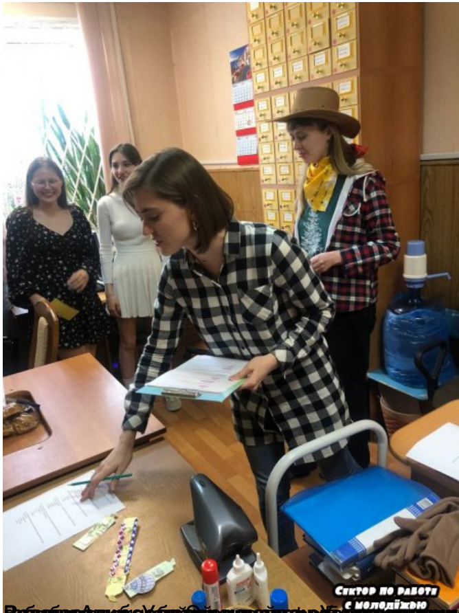
Вибір Аніме-Кіші для проведення КВБ з теми «Відомі українські імена в абстрактній мові»