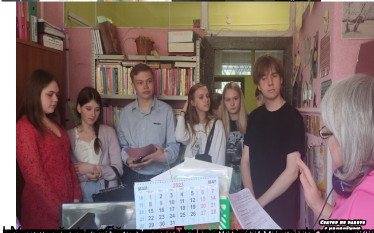
Молодые люди рассматривают календарь в библиотеке