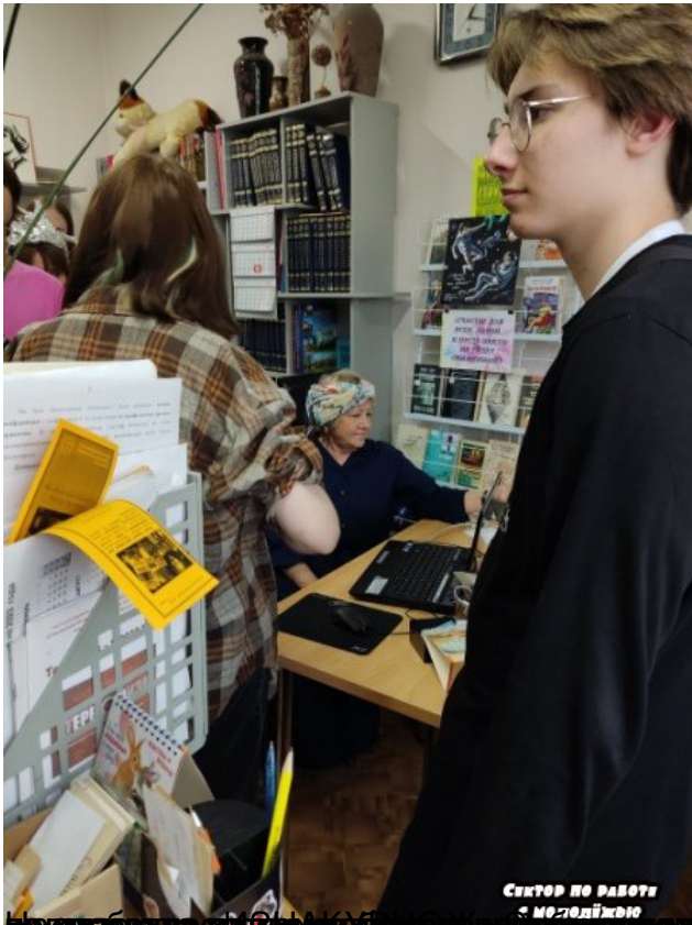
Молодой человек общается с сотрудницей библиотеки