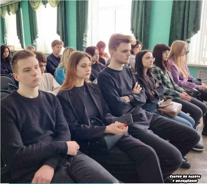
Сектор по работе с молодежью