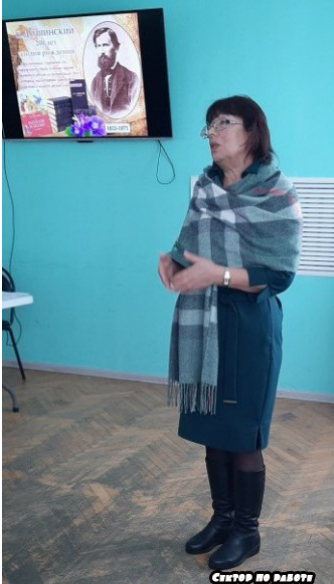
Сектор по работе с молодежью

В результате образовательного процесса в школе языковые компетенции учащихся невосполнимы и невосполнимы, что обусловлено