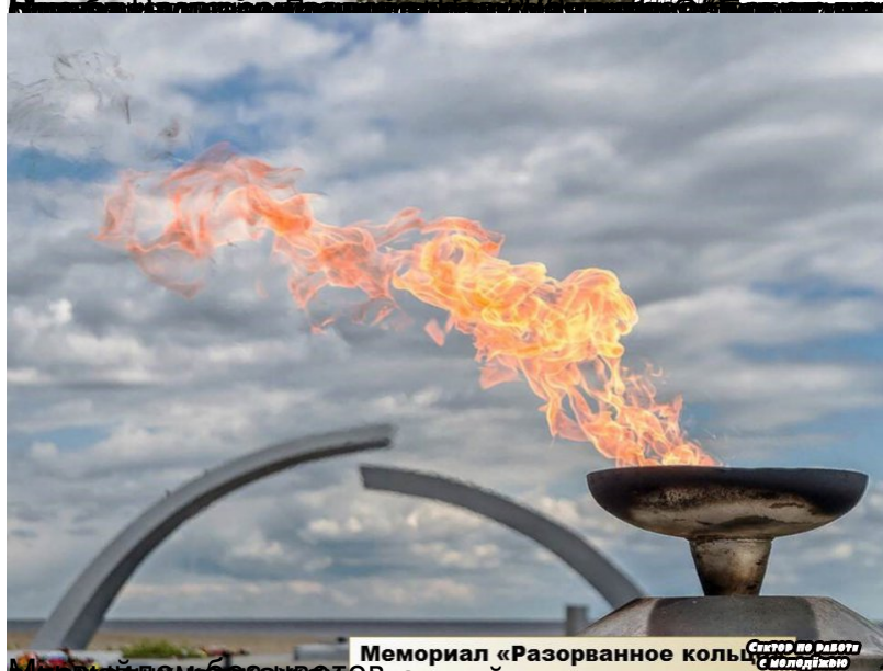
Мемориал «Разорванное кольцо» в Ленинграде, посвященный обороне Ленинграда