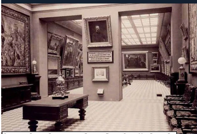
Экспозиция Городской художественной галереи Павла и Сергея Михайловичей Третьяковых. Мемориальный зал Сергея Михайловича. Фото 1898 года.