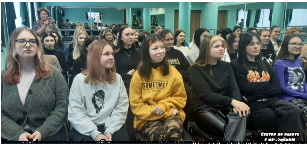
Сектор по работе с молодежью