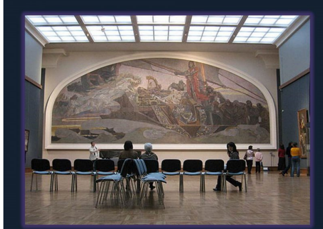
Г.Г. Зел М. Врубеля