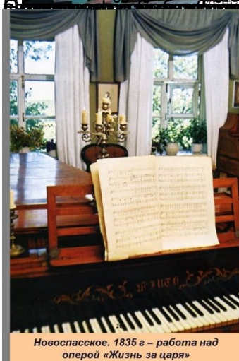
Новоспаское, 1835 г – работа над оперой «Жизнь за царя»