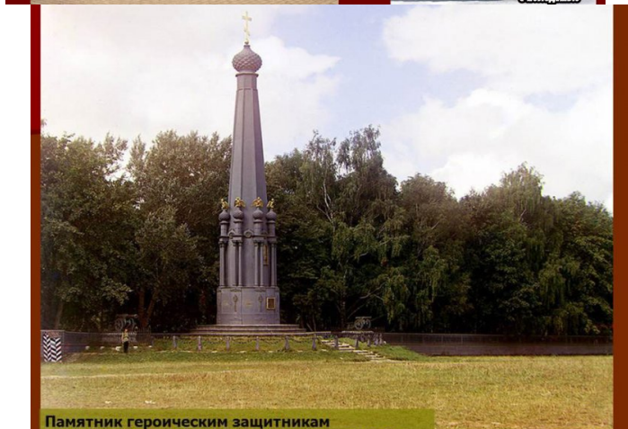
Памятник героическим защитникам Смоленска 4-5 августа 1812 года. Фото 1912 г. Виртуальная экскурсия для молодежи о героическом обороне Смоленска в 1812 году – лектор рассказывает о героическом обороне Смоленска в 1812 году