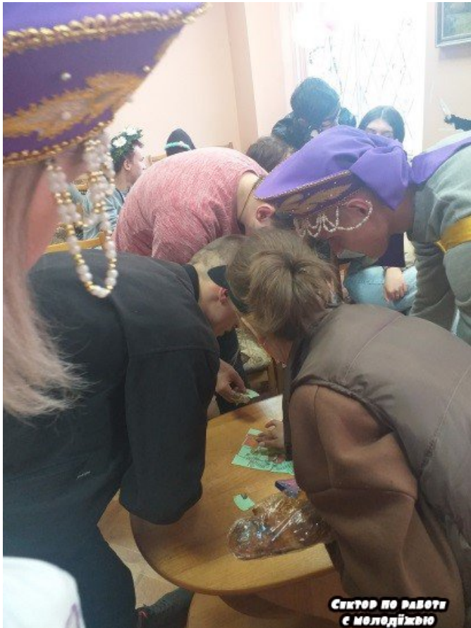
Сектор по роботі с молодіжню