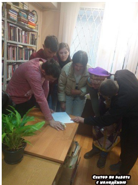
СЕКТОР ПО РАБОТУ с МОЛОДІЖЬЮ