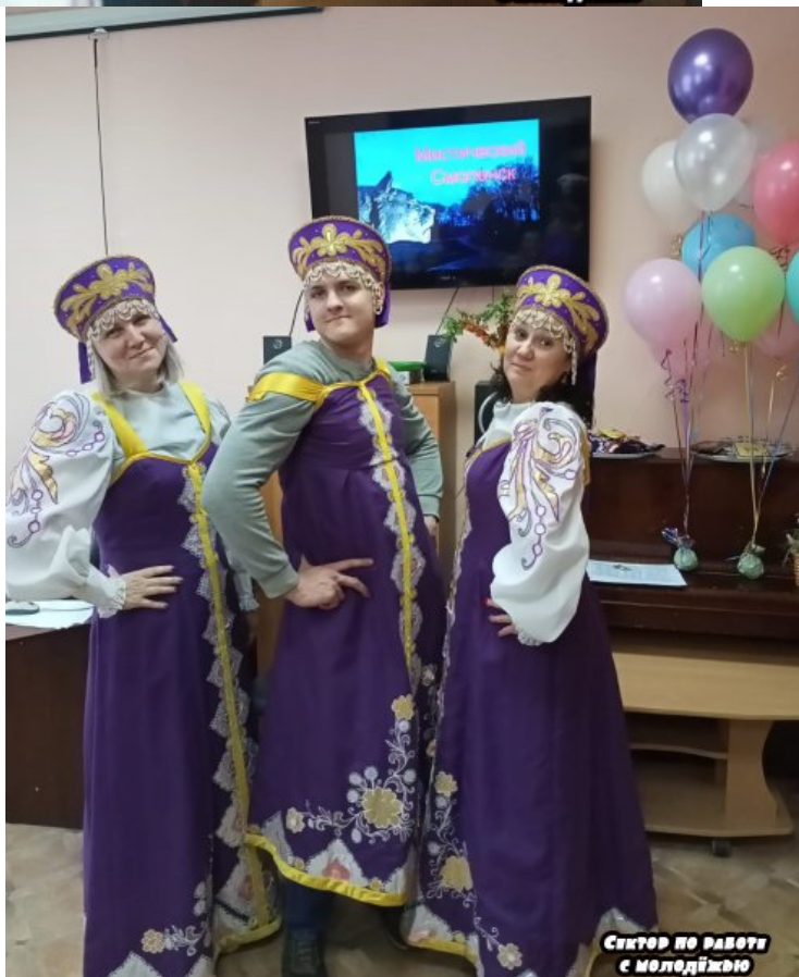
Сектор по роботі с молодіжню