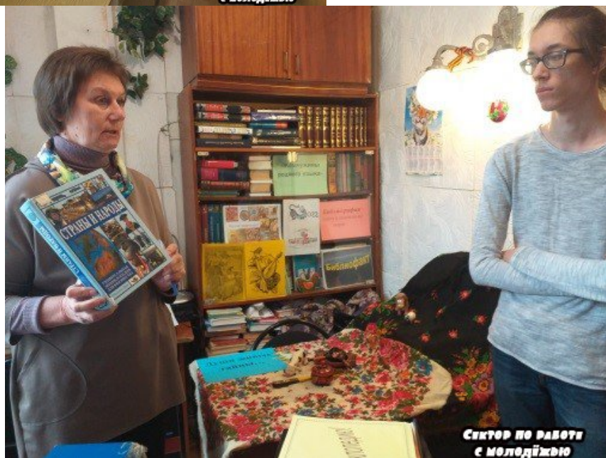
СЕКТОР ПО РАБОТУ с МОЛОДІЖЬЮ