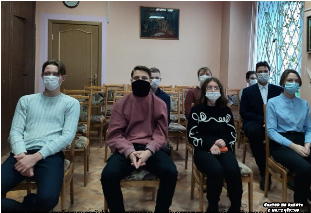
Відвідувачі заходу виступили з пропозиціями щодо організації краєзнавчих заходів у музеї.