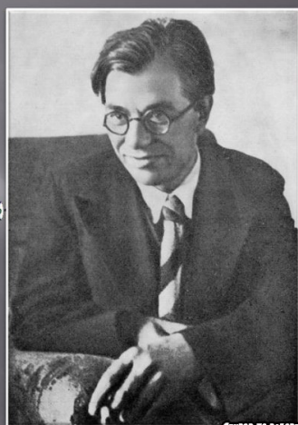
СЕКТОР ПО РАБОТІ С МОЛОДІЗЬЮ