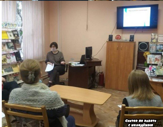
Сектор по работе с молодежью