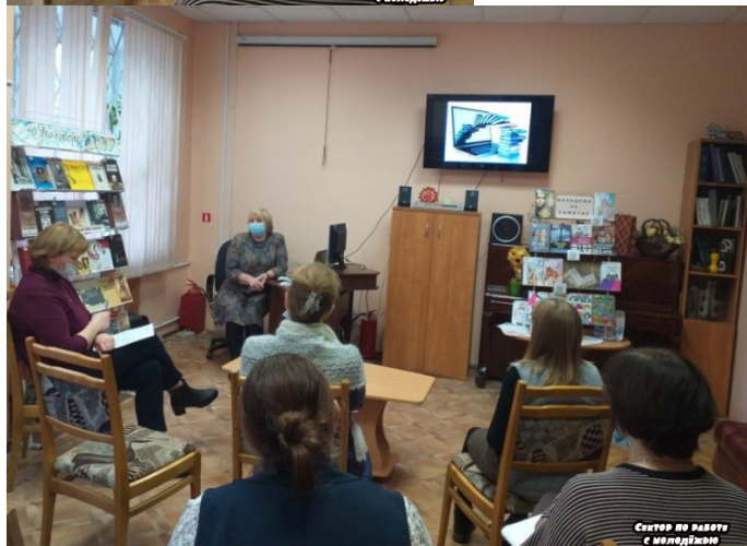
Сектор по работе с молодежью