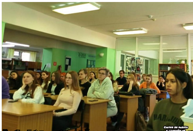
Сектор по работе с молодежью