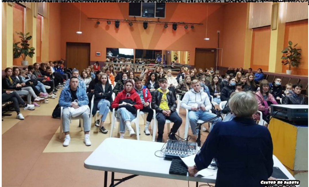
Участники мероприятия в зале школы имени Д.Б. Родина в г. Ижевск