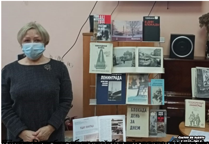
Музей «Страницы блокадного Ленинграда»