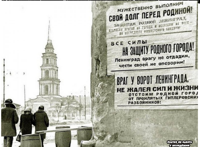
Сектор по работе с молодежью