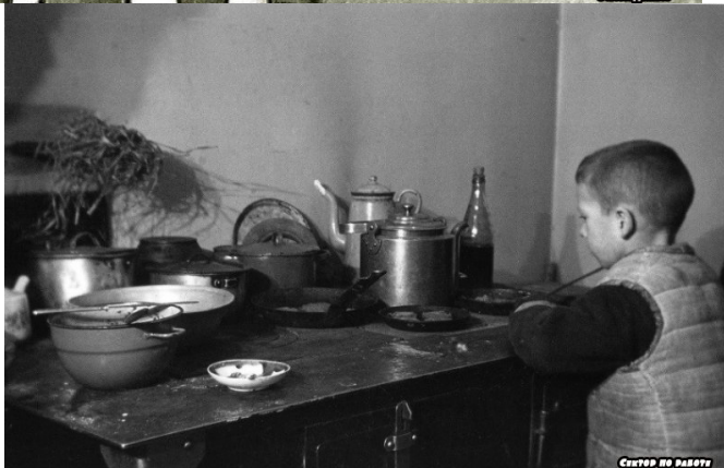
Сектор по работе с молодежью