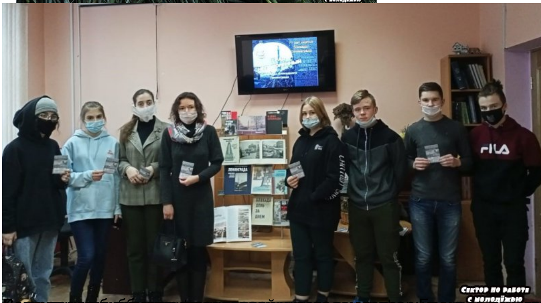
Сектор по работе с молодежью