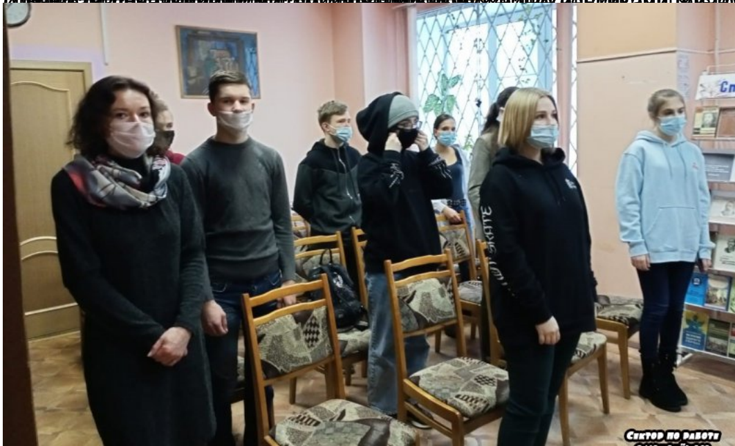
Сектор по работе с молодежью