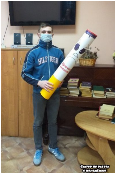
СЕКТОР ПО РАБОТЕ С МОЛОДЁЖЬЮ