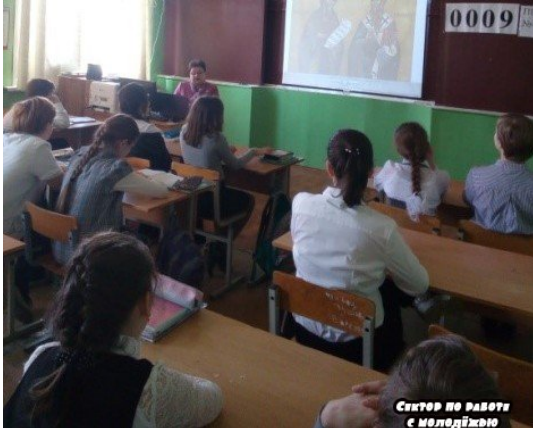
Фрагмент видеобеседы «Православная культура как путь к духовности и нравственности»