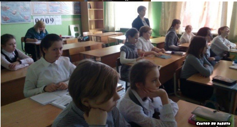
Фрагмент видеобеседы «Православная культура как путь к духовности и нравственности»