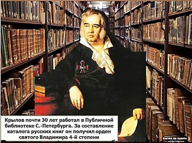
Крылов почти 30 лет работал в Публичной библиотеке С.-Петербурга. За составление каталога русских книг он получил орден святого Владимира 4-й степени