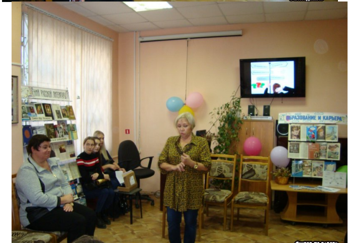
Презентация проекта «Мастерград» для молодежи в Центре занятости населения г. Ижевска.