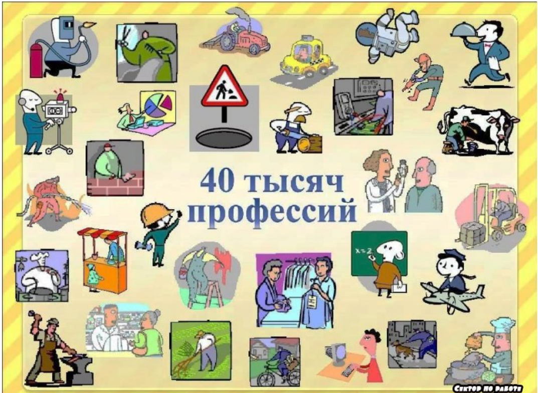
Брошюра «40 тысяч профессий» разработана в рамках проекта «Мастерград» в сотрудничестве с Центром занятости населения г. Ижевска.