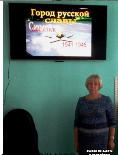
Сектор по работе с молодежью