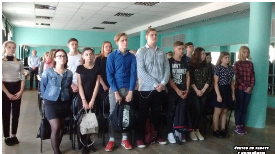
Сектор по работе с молодежью