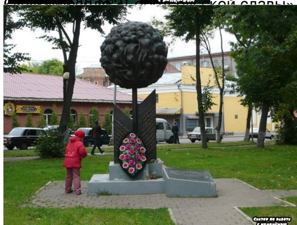
Сектор по работе с молодежью

Город русской славы была также проведена для третьего и для пятого