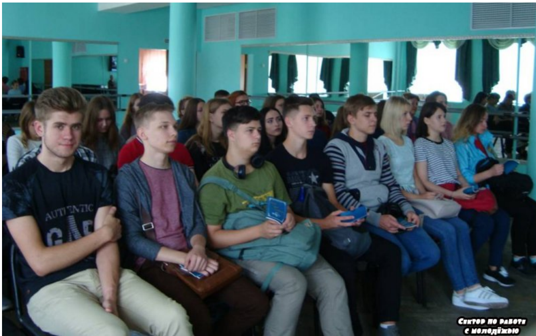
Сектор по работе с молодежью