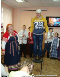
участниками ансамбля, школьники сыграли на народных инструментах.