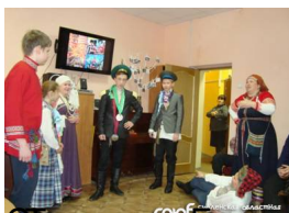
участие в хороводе-игре «Клубок» и забавной игре