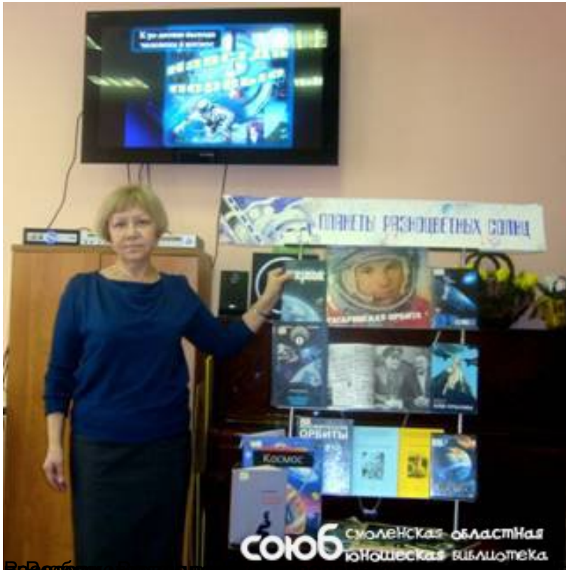
Тема: "Космос". Автор: [unreadable]