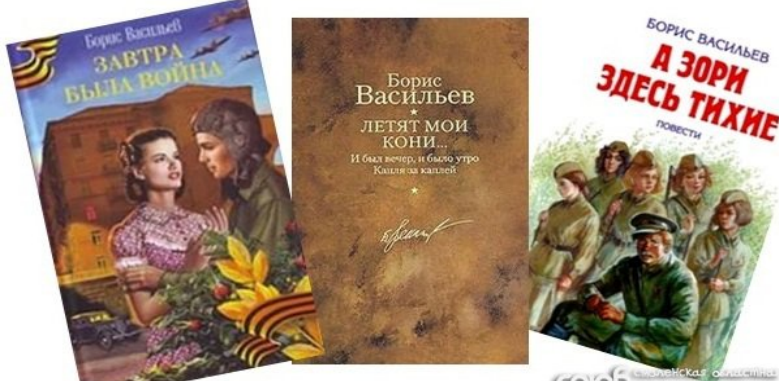
Книжки Бориса Васильева библиографического отдела