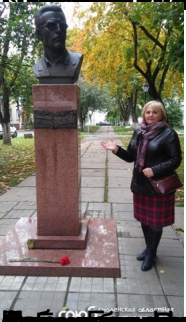
Бюст В.И. Склясова в библиотеке