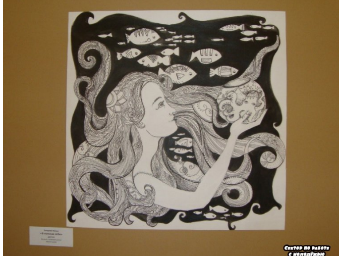
Сектор по работе с молодежью